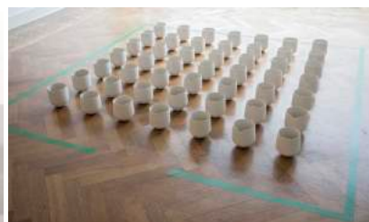
Nature morte blanche , 2010, grès. Champ d'honneur , 2015, porcelaine.