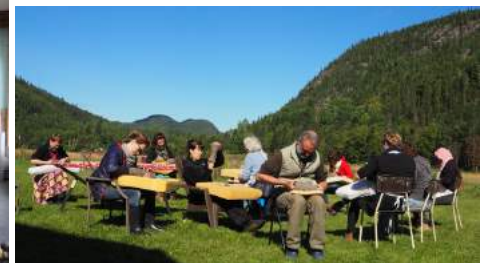
Couleur Céramique 2016.