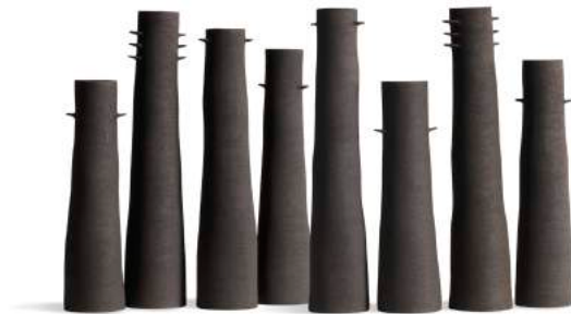
6 x 4 variations, grès, 2015. Forêt de baobabs, grès, 2009.