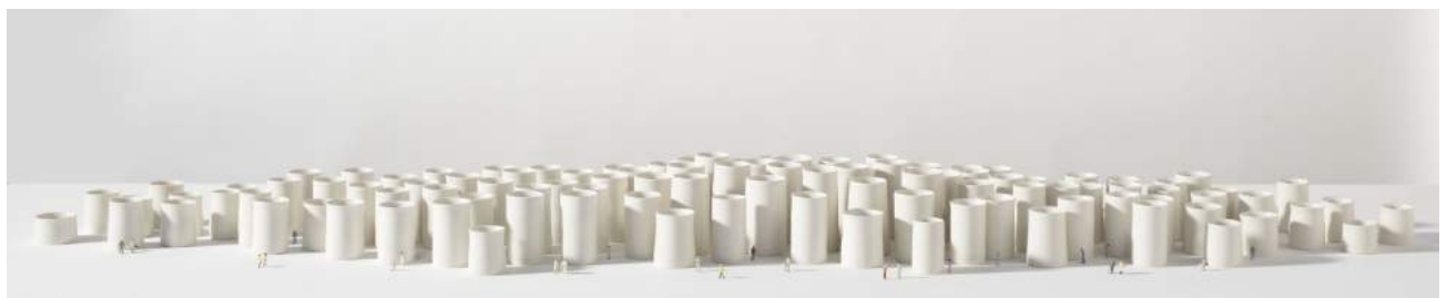
Virginie Besengez, Cup Town , porcelaine, personnages plastique, 2009, H. 10 x 200 cm.

Carole Andréani - La Revue de la Céramique et du Verre , 2008.