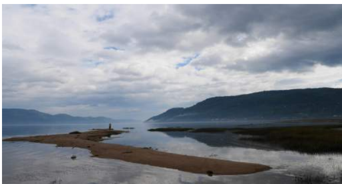
Le fjord à l'Anse-St-Jean. Virginie Besengez, Trois marmites , grès blanc, 2011.